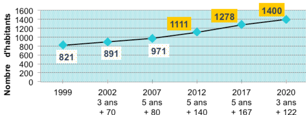
Population Totale entre 1999 et 2020

Les données démographiques ci-dessus proviennent des chiffres officiels obtenus lors des recensements entre 1999 et 2017. On constate qu'entre 1999 et 2007 l'augmentation de la population de notre village se développe de façon régulière et cohérente.