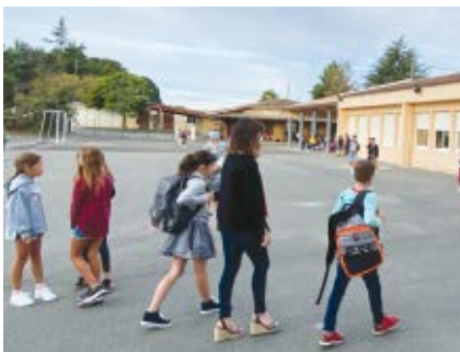
L'heure de la rentrée a sonné !