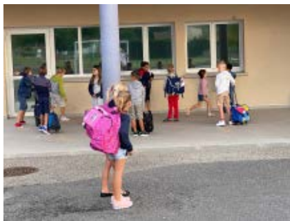
Vive la rentrée !