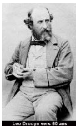
Leo Drouyn vers 60 ans