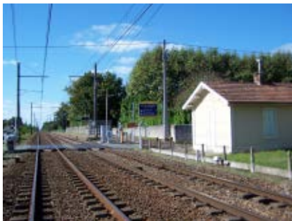
La gare d'Arbanats